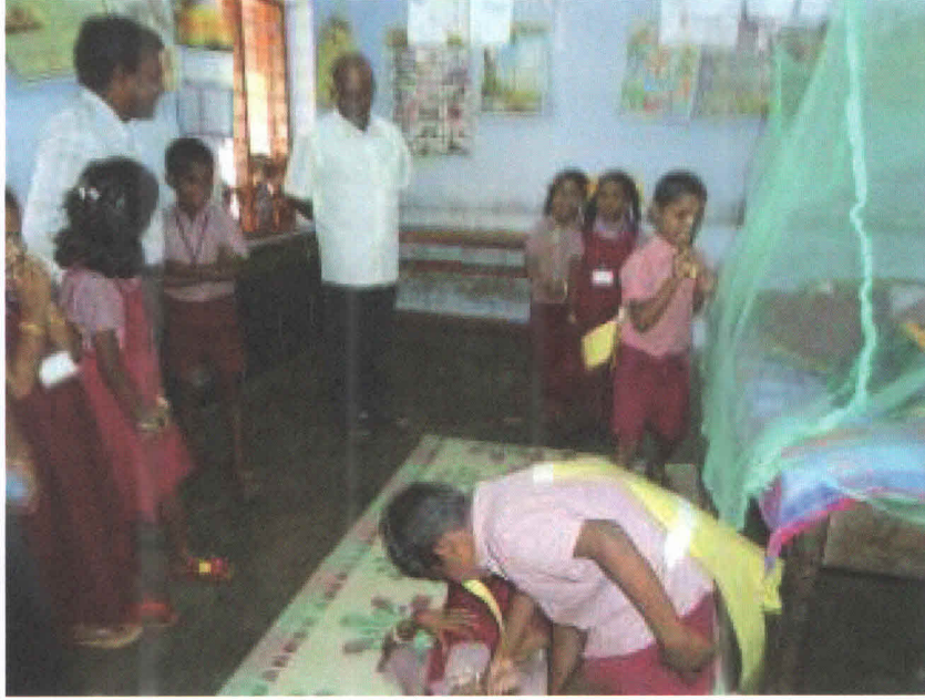
Figure 7 Mosquito Net Usage Demo by children

கடிப்பது போன்று நடித்து காட்டப்பட்டது. இதிலிருந்து கொசுவலையை பயன்படுத்துவது மிக முக்கியமாகும், கொசுவினால் பரவும் நோய்களிலிருந்து பாதுகாக்க மேற்கண்ட முறைகளைக் கையாள்வது மிக முக்கியம் என்பதை உணர்த்துகிறது.