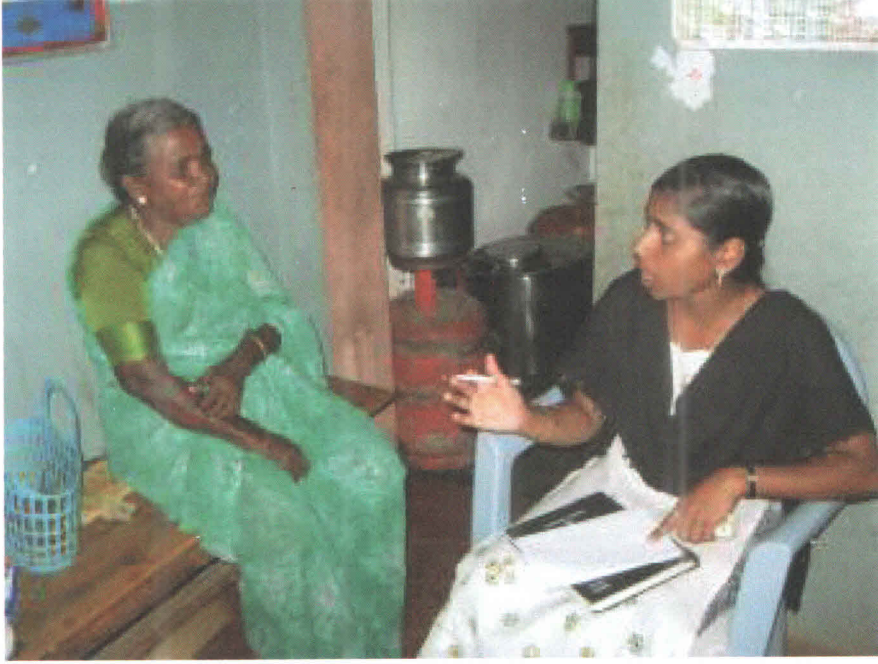
Figure 4 Home Based Awareness Campaign

நான் குறிப்பாக கரியமாணிக்கபுரம் ஊராட்சிக்கு கீழ் உள்ள கிராமமான குளத்தூர் கிராமத்தில் ஒரு ஆய்வு செய்தேன் . முக்கியமாக செப்டிக் டேங்க், கழிவறை வசதி மற்றும் குப்பைத் தொட்டி பற்றியும் ஒரு ஆய்வு செய்தேன் . அதன் மூலம் அந்த கிராமத்தில் 150- க்கு உட்பட்ட வீடுகள் இருக்கின்றன. ஆனால் அங்கு குப்பைத் தொட்டி வசதியில்லாமை காரணமாக அவர்கள் குப்பைகளை குளங்களில் மற்றும் ஆறுகளில் கொட்டுகின்றனர் என்றும், கழிவறை வசதியானது 25% மக்களுக்கு இல்லாமை, அவர்கள் திறந்த வெளியில் கழிப்பிடம் செய்வதையும், அதிலும் சில பெண்கள் பொது கழிப்பறைகளைப் பயன்படுத்துவதையும், 50-க்கு மேற்பட்ட வீடுகளில் கழிவறை வசதி இருந்தும் செப்டிக் டேங்க் கட்டாமல் இருப்பதையும் ஆய்வு மூலம் தெரிந்து கொண்டேன். அதன் பிறகு அந்த செப்டிக் டேங்க் இல்லாத வீடுகளில் அந்த கழிவுகளை அருகில் இருக்கும் குளங்களுக்கு விடுவதே மிகவும் வருத்தமளிப்பதாகும் . ஆனால் அது பற்றி அந்த குடும்பங்களிடம் பேசும் போது அவர்களின் பிரச்சனையான இடவசதியின்மையும் மற்றும் ஒரு சிலர் அதை அலட்சியமாக எடுப்பதையும் தெரிந்து கொண்டேன் . பின்னர் மக்களிடம் அதனால் வரும் நோய்கள் பற்றி கிராம நல குழுவில் ஊராட்சித் தலைவியின் முன்னிலையில் விளக்கினோம். அது மட்டுமல்லாமல் வார்டு உறுப்பினர்களைக் கொண்டு