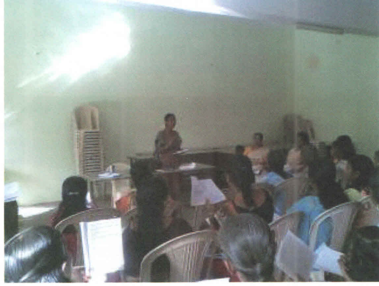
Figure 3 Training @ Anbiyam (Neighbourhood Committee)

குடும்பங்களுக்கு விளக்குகின்றனர். இது மிகவும் எளிதான, சிறப்பான முறையாகும் சமுதாயத்தில் தகவல்களை தெரிவிப்பதற்கு.