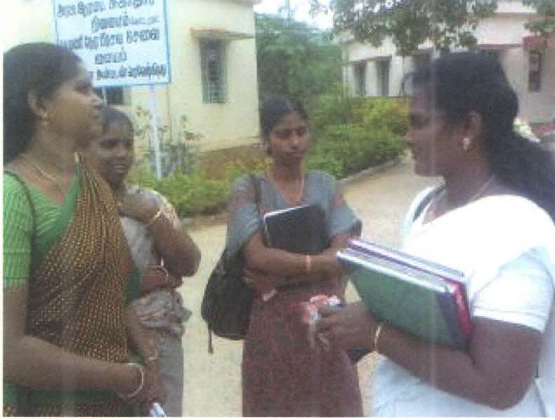
Figure 2 Talking with VHN about the Village Visit

மருத்துவமனைக்கு செல்லாமை ஆகும் என்பதை அறிந்து கொண்டேன். அதுமட்டுமல்லாமல் அரசு மருத்துவமனைக்கு செல்வதற்கு போதிய பேருந்து வசதியின்மை, நீண்ட தூரம் பயணம் இதுவும் ஒரு முக்கியமான காரணமாகும் என்பதை பயிற்சிக்கு வந்த உறுப்பினர்களின் விவாதத்தின்போது அறிந்து கொண்டேன்.