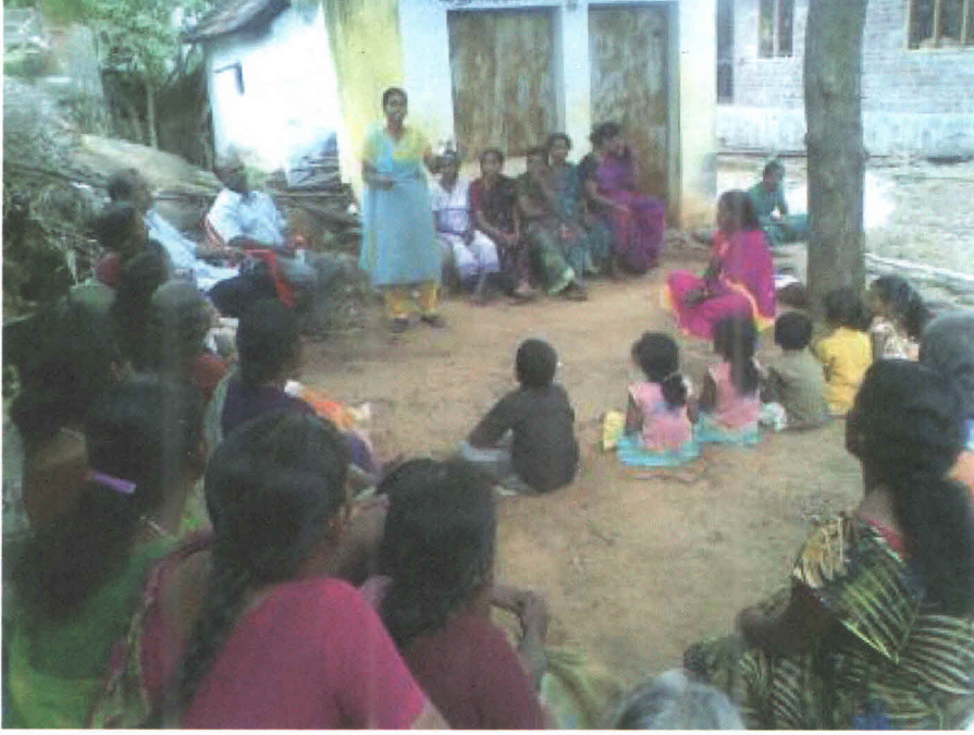
Figure 1 Training to VHWSC

நடைமுறைப்படுத்தும்போது தான் அதைப் பற்றி முழுமையாக, மிகவும் விவரமாகவும் புரிந்து கொள்ளலாம் என்பதை நான் தெரிந்து கொண்டேன்.